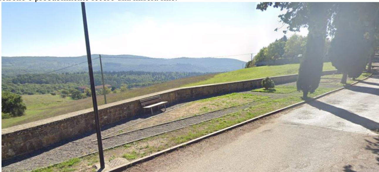
Figura 1 Il luogo dove sorgeva il Parco delle Rimembranze di Montegabbione.